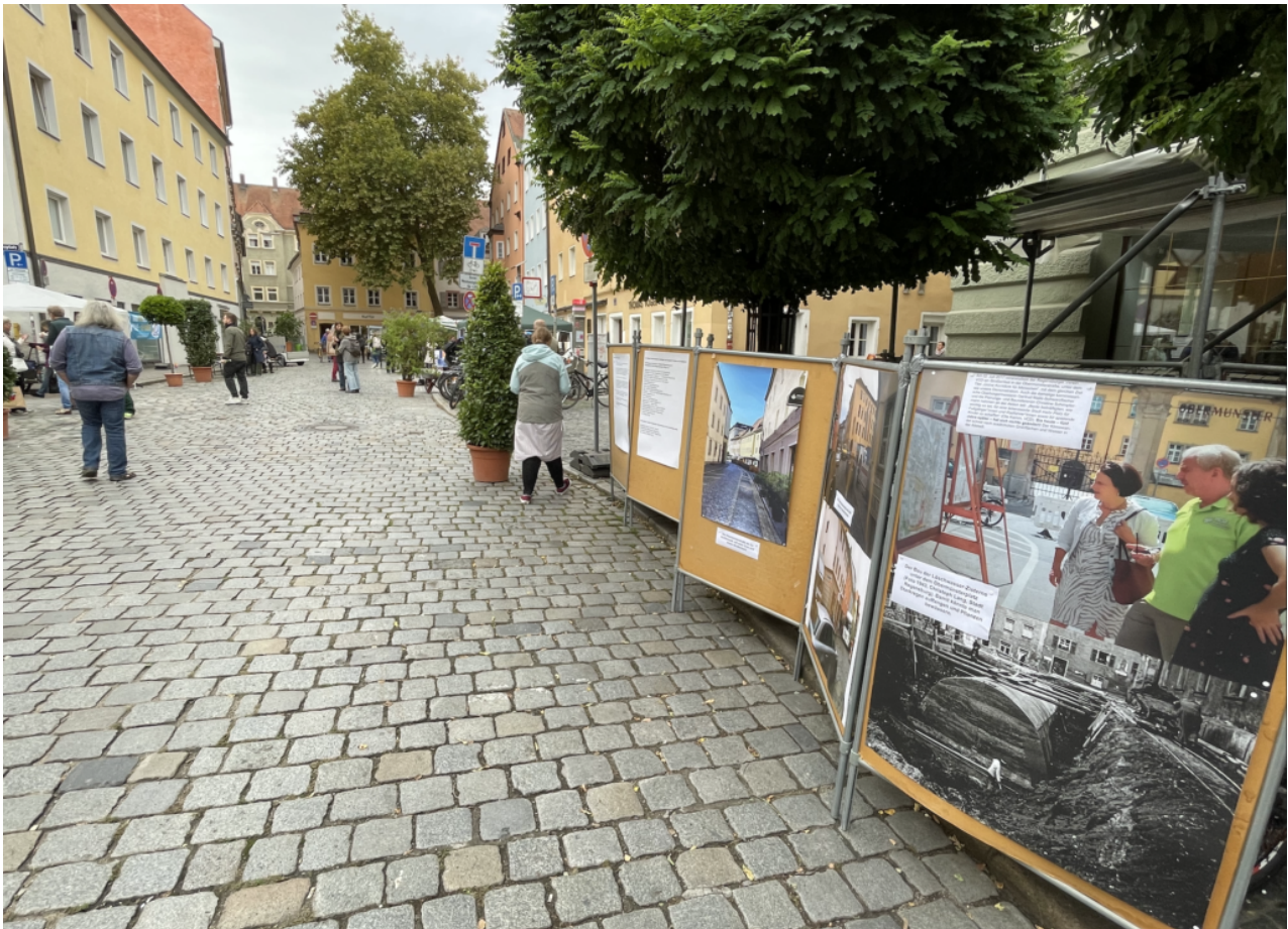
Erinnerungen an die folgenlosen Beteiligungsworkshops am Straßenrand.

September 2022. Von den großen Versprechen ist nichts außer Erinnerungen geblieben. „Seit 36 Jahren wohne ich hier“, sagt vergangenen Freitag eine Anwohnerin. Vor elf Jahren habe sie sich intensiv an den Planungen beteiligt. „Aber bis heute verkommt das Viertel immer mehr und nichts passiert.“ So könne man eine Stadt ohne großes Zutun nachhaltig kaputt machen. Durch Tatenlosigkeit.